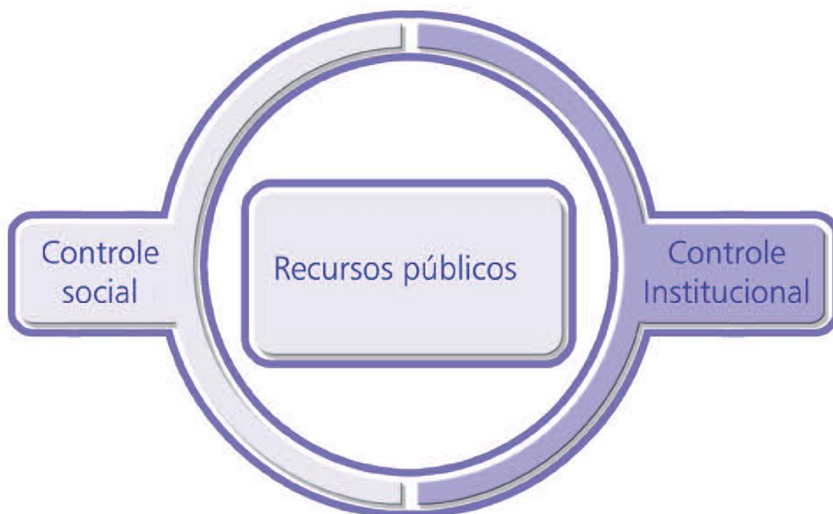
Figura 3 Gestão de recursos públicos