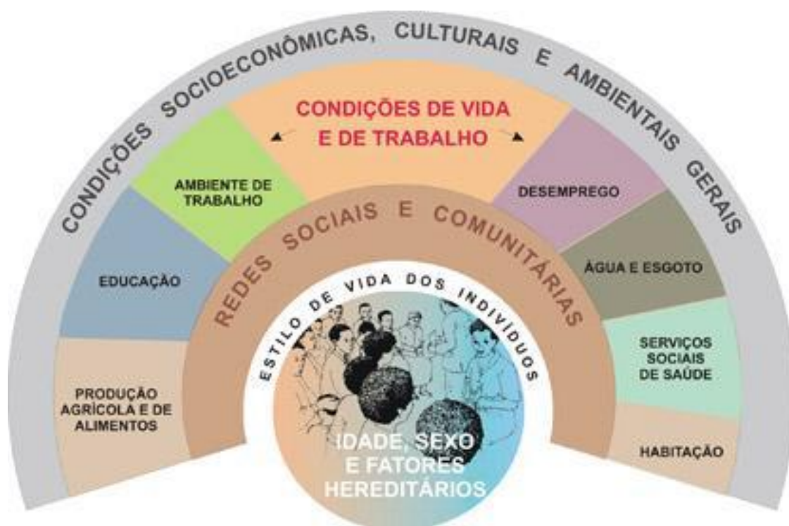
Figura 2 Modelo de determinantes sociais da saúde, Dahlgren e Whitehead (1991)

sociais e ambientais de uma comunidade em determinado território influem em seu modo de viver e na qualidade de vida.