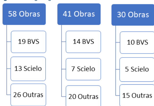
Figura 1 - Organograma das fases da revisão de literatura.

A seleção se deu com base nos critérios de inclusão e exclusão, tendo como base de inclusão de obras nacionais, publicadas entre 2013 e 2018, disponíveis de forma gratuita e relativas à febre amarela. A exclusão de obras publicadas anteriores a 2013, repetidas em outras bases de dados ou incompatíveis com o tema, conforme Organograma apresentado na Figura 1 .