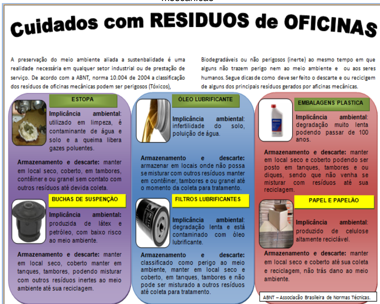
Figura 1 folder demonstrativo forma correta de descarte de residuos de oficinas mecânicas

Folder informativo, de acordo com Associação Brasileira de Normas Técnicas - (ABNT) 10.004 de novembro de 2004 e Lei da Política Nacional de Resíduos Sólidos - (PNRS) 12.305, de agosto de 2010 onde abrangem as definições de resíduos, como classificação e grau de danos ao meio ambiente, disponibilizado de figuras retiradas do Google imagens.