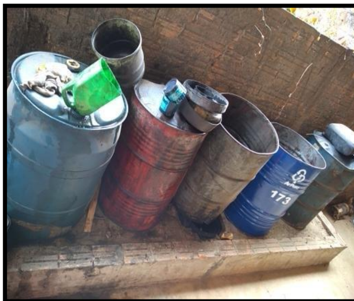
Figura 1. Demonstra a segregação de resíduos perigosos, como se pede na NBR 12235, Armazenamento de óleo, filtros e embalagens de óleo lubrificante