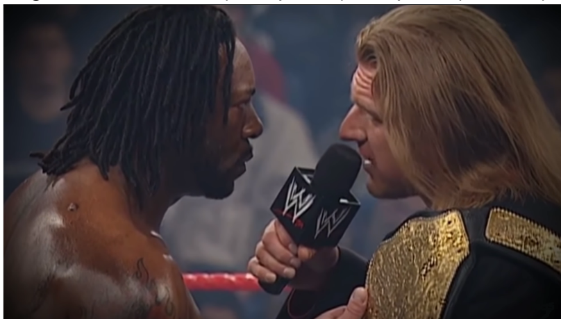
Figura 10 - Booker T (à esquerda) e Triple H (à direita).

Outra situação envolvendo o racismo ocorreu não somente em uma promo, mas quase que durante toda a rivalidade de Booker T e Triple H no início de 2003. A rivalidade se iniciou mais precisamente em 24 de fevereiro de 2003, onde em uma edição do programa semanal Monday Night Raw , Booker T venceu uma Battle Royal de 20 lutadores para se tornar o desafiante principal pelo Título Mundial de Pesos Pesados (WWE, 2003a), que estava em posse do campeão Triple H.