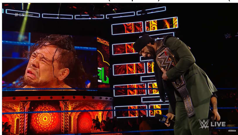
Figura 08 - Shinsuke Nakamura (à esquerda) e Jinder Mahal (à direita).

Outra situação parecida que ocorreu mais recentemente em setembro de 2017 foi a de Jinder Mahal e Shinsuke Nakamura. Mahal era o Campeão da WWE na época e seu personagem era o “marajá dos dias atuais” 19 : um indiano heel que vivia cercado de luxos e serviçais.