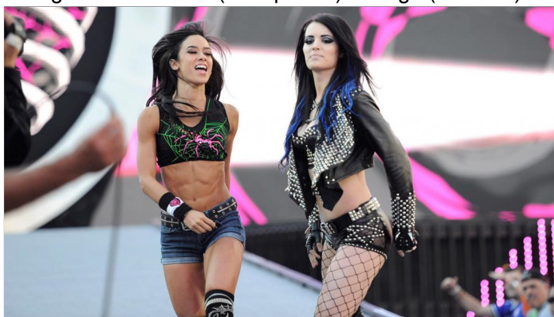
Figura 14 - AJ Lee (à esquerda) e Paige (à direita).