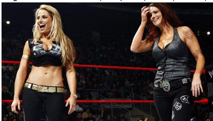
Figura 13 - Trish Stratus (à esquerda) e Lita (à direita).

No início dos anos 2000, nomes importantes na história feminina da WWE fizeram sua estreia: Molly Holly, que diferentemente do padrão da época, lutava com roupas mais modestas e tinha um personagem menos sexualizado. Lita, que apesar de ter sido sexualizada algumas vezes, performava de maneira mais arriscada, se aproximando mais das lutas masculinas com saltos mortais e vôos, sendo pioneira na divisão feminina ao utilizar-se desses movimentos. E Trish Stratus, que estreou extremamente sexualizada como uma acompanhante, mas alguns anos depois, o foco mudou para sua performance em ringue e teve, junto à Lita, uma das, se não a maior rivalidade feminina da WWE, recheada de histórias bem contadas e focadas no wrestling , além de excelentes combates que antes só víamos na divisão masculina.