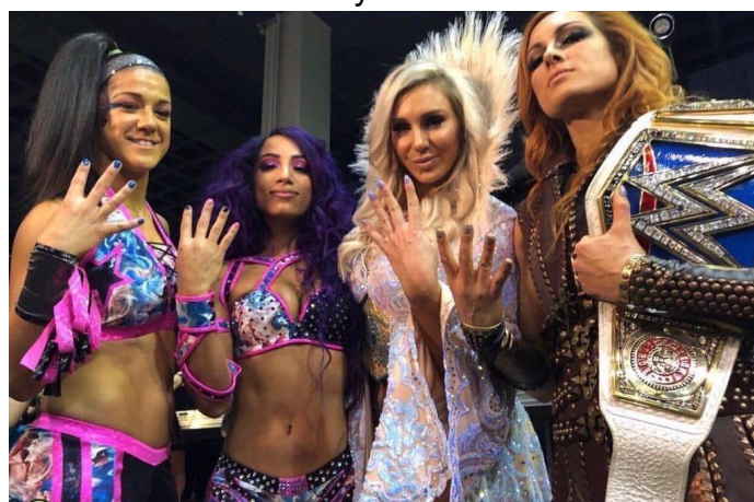
Figura 15 - Da esquerda para a direita: Bayley, Sasha Banks, Charlotte Flair e Becky Lynch.

Com a “promoção” para os shows principais, Paige deixou o Título Feminino do NXT vago, que foi posto em um novo torneio para coroar a próxima campeã, torneio este vencido por Charlotte Flair (WWE, 2014b). Conhecida como “A Rainha”, filha do lendário lutador da WWE Ric Flair, Charlotte passou a dominar o cenário feminino do NXT junto com outras três lutadoras (Bayley, Becky Lynch e Sasha Banks), que foram apelidadas de “As Quatro Cavaleiras” 38 , tendo Charlotte, Sasha e Bayley sido campeãs do NXT em sequência (WWE, 2015a, 2015b).