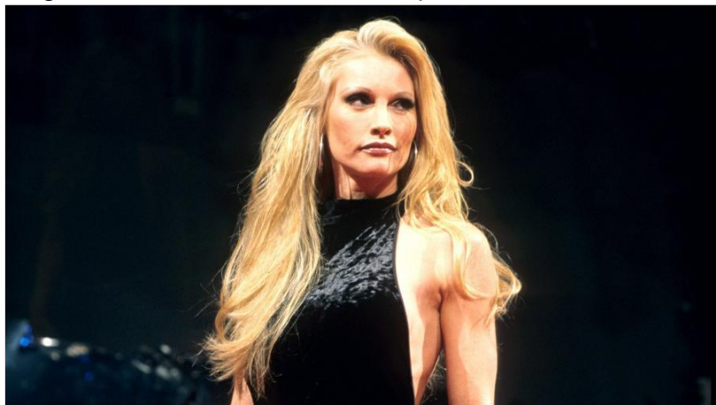
Figura 11 - Sable, uma vez campeã feminina da WWE.

passos para sua ascensão, porém, para cortar gastos, Blayze foi demitida no final de 1995 e o título feminino voltou a ser desativado até 1998, deixando o público feminino novamente sem representantes credíveis.