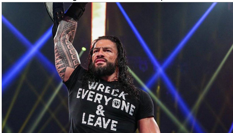
Figura 06 - Roman Reigns, cinco vezes campeão mundial da WWE.

Apesar da classificação indicativa continuar até os dias atuais, outras duas eras ainda surgiram: a Era da Realidade 15 (2014-2016), caracterizado pela expansão das redes sociais, o que permitiu aos fãs compartilharem e discutirem sobre assuntos internos da WWE, além de expressarem seus sentimentos em relação às decisões tomadas dentro da empresa, sendo o início de uma mudança significativa no produto da WWE em relação às suas estrelas femininas que se daria no início da próxima era. A Era da Realidade foi a época em que nomes como Daniel Bryan, Roman Reigns e Seth Rollins tiveram sua ascensão.