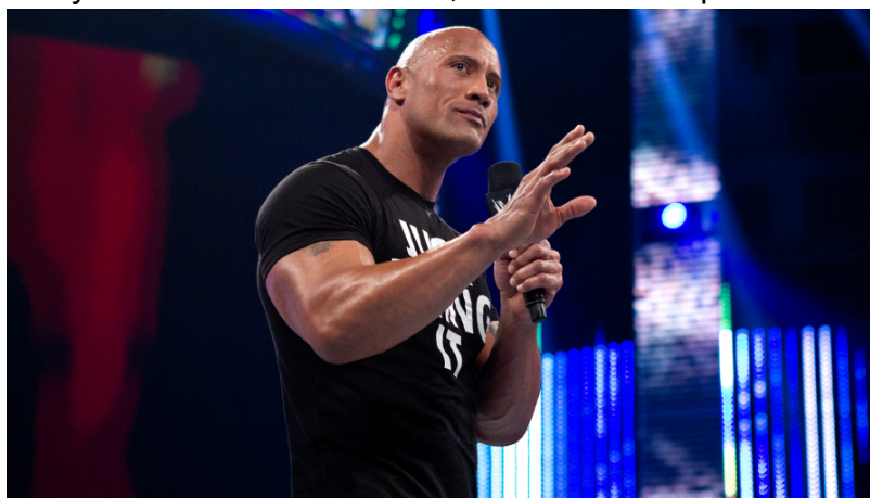
Figura 04 - Dwayne “The Rock” Johnson, dez vezes campeão mundial da WWE.

A WCW se manteve invicta na liderança da audiência até o final de 1996, quando a WWF decidiu mudar drasticamente seu produto, transformando seu show de um produto familiar em um produto mais voltado ao público adulto, essa época ficou conhecida como a Era da Atitude 11 (1997-2002), sendo caracterizada por lutas e segmentos mais violentos e sangrentos, desrespeito às normas e leis gerais através de bullyings e de produtos e mulheres sexualizadas, neste meio, houve a ascensão de novas estrelas como lendário Dwayne “The Rock” Johnson e o anti-herói “Stone Cold” Steve Austin.