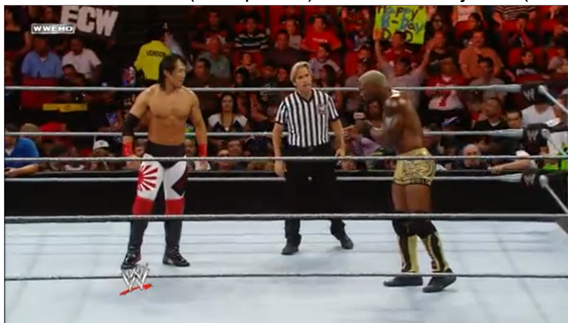
Figura 07 - Yoshi Tatsu (à esquerda) e Shelton Benjamin (à direita).

Este primeiro exemplo de xenofobia ocorreu durante a estreia de Yoshi Tatsu no programa semanal ECW da WWE em junho de 2009, o Yoshi Tatsu estava agendado para lutar contra o Shelton Benjamin, que na época era conhecido também como o “padrão-ouro” 17 , que fazia referência ao nível de seu talento em ringue, caracterizado por manobras mais arriscadas, como vôos e saltos e movimentos técnicos do wrestling amador.