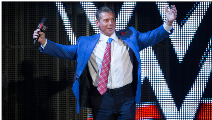
Figura 02 - Vince McMahon, diretor executivo da WWE.

World Wrestling Federation (WWF) até o final do século. Em 1983 Vincent J. McMahon vendeu sua parte da empresa para seu filho Vincent “Vince” K. McMahon, que passou então a chefiar a WWF/WWE até os dias atuais.