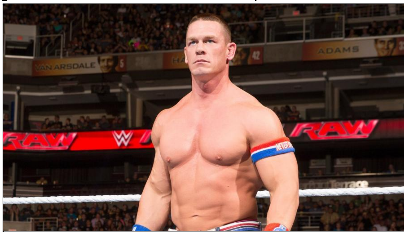
Figura 05 - John Cena, 16 vezes campeão mundial da WWE.

Em 2002, a WWF anunciou a troca de seu nome para World Wrestling Entertainment (WWE), após perder um processo iniciado pela marca World Wildlife Fund sobre a sigla WWF (ONECLE, 1994). Com essa derrota, a WWE aproveitou a oportunidade para dar ênfase no entretenimento em seus produtos (WWE, 2002), iniciando aqui a Era da Agressão Impiedosa 12 (2002-2008), época em que surgiram nomes como Brock Lesnar, Randy Orton e John Cena, sendo este último o principal lutador ativo da WWE por mais de dez anos.