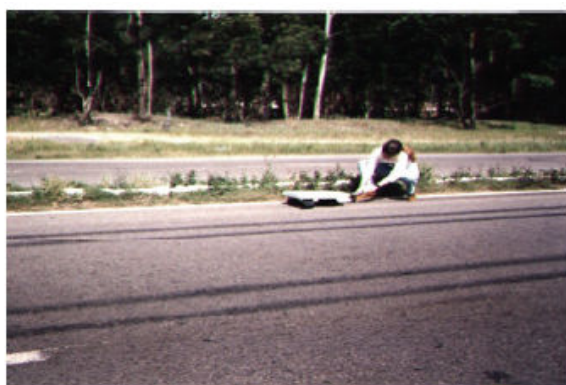
Figura 2 - Atrito dos pneus marcas de derrapagens

a) Atrito: segundo Aragão (2003) o atrito pode acontecer de duas formas, atrito de escorregamento, deslizamento ou arrastamento. Analisando teoricamente Aragão (2003, p. 169) diz que, “o coeficiente de atrito de rolagem é maior do que o coeficiente de deslizamento. Conseqüentemente, o atrito de deslizamento é menor que o atrito de rolamento”. Assim, conforme Kleer, Thielo e Santos (1997) a razão do atrito é visualizada pela fórmula: \mu = \frac{F_a}{N} ou F_a = \mu N . Onde \mu é uma constante denominada coeficiente de atrito, seu valor geralmente é menor que 1, N é a força normal de reação e o atrito F_a é aproximada e diretamente proporcional à força normal de reação N . Desse modo, o valor de \mu entre o pneu e a superfície da estrada é o valor chave na investigação dos acidentes. Como exemplo pode-se citar: ao lançar um corpo sobre uma mesa comum horizontal, ele para após percorrer certa distância, significa dizer que houve resistência, tem-se a força de atrito agindo sobre o corpo.