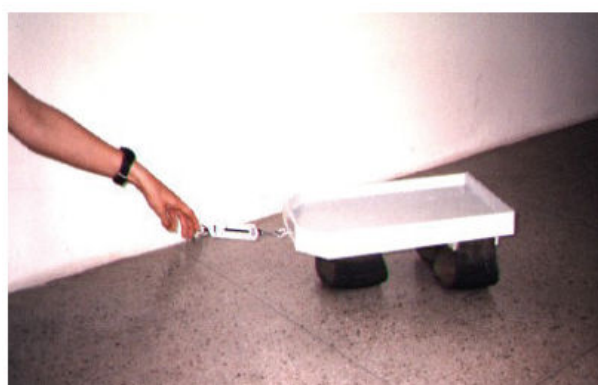
Figura 3 - Arrastando aparelho para medir coeficiente de atrito