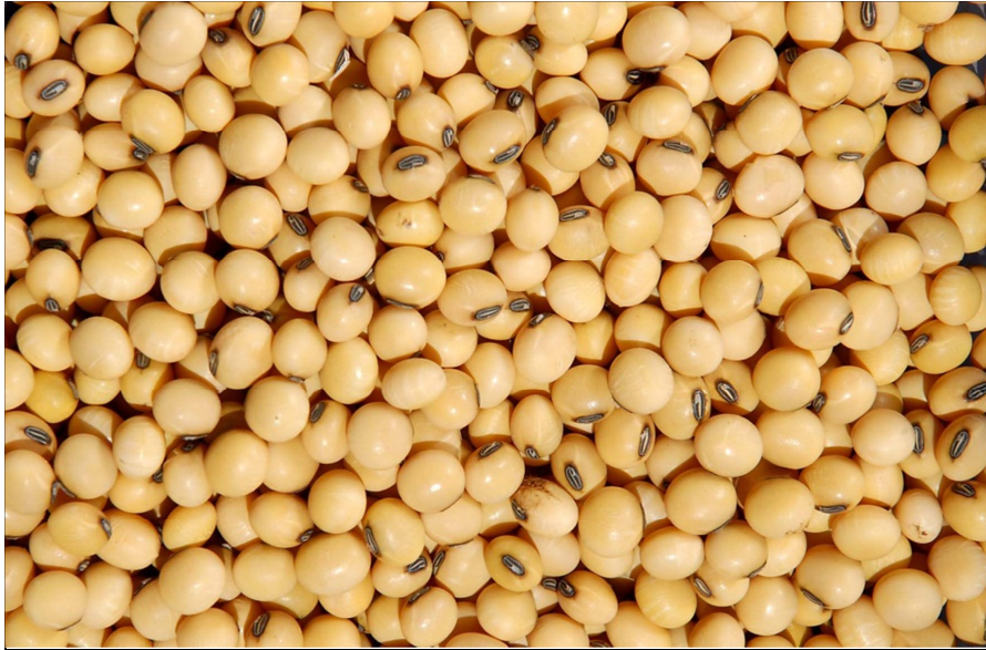
Figura 02 – Imagem da soja em grãos

Da Silva (2008) traz também que o extrato de soja, frequentemente conhecido como “leite de soja”, é uma excelente opção para aqueles que almejam ter uma dieta rica em nutrientes e principalmente proteínas, pois a soja e seus derivados proporcionam quase o dobro de proteínas encontradas nas carnes. E também é uma alternativa às pessoas que por ventura tem intolerância à lactose e aos que possuem uma alimentação vegetariana. A ingesta desse produto tem aumentado nos últimos tempos pelo fato de ter sido comprovado em atuais estudos as benfeitorias para a saúde, como fonte preventiva das doenças crônico-degenerativas, através da isoflavonas.