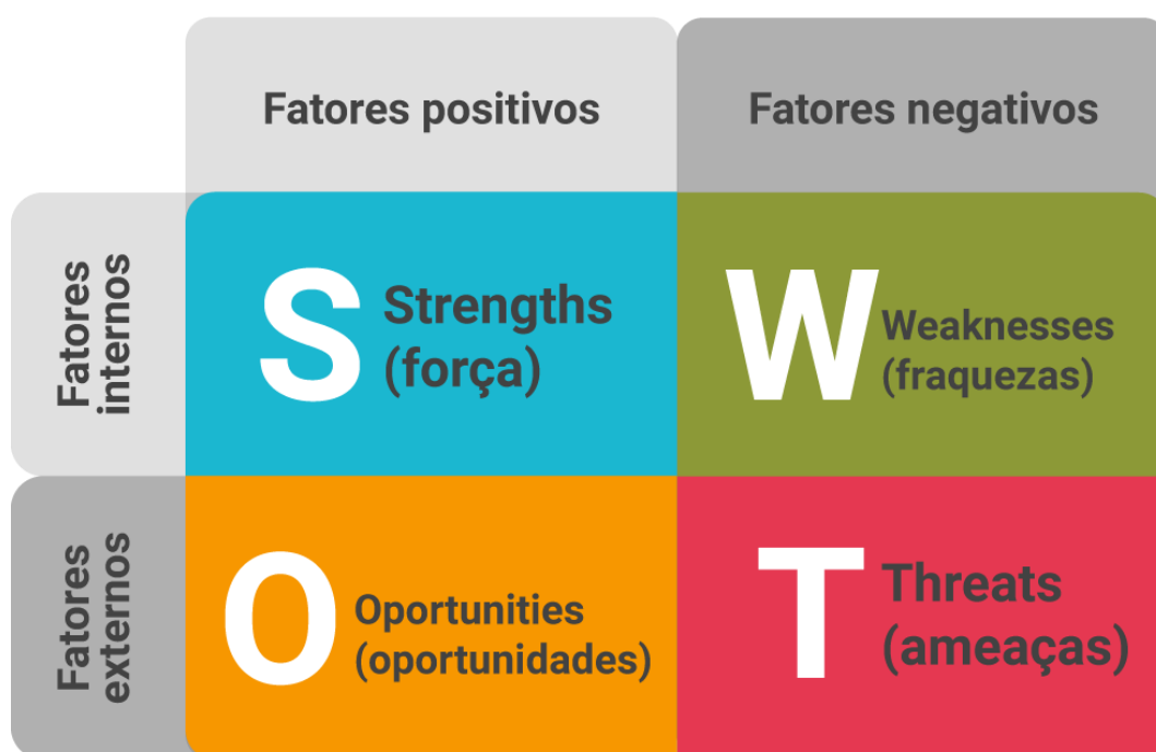
Figura 1. Análise de matriz SWOT.

A sigla SWOT vem das iniciais das palavras inglesas: STRENGTHS (forças), WEAKNESSES (fraquezas), OPPORTUNITIES (oportunidades), THREATS (ameaças). Estes são justamente os pontos a serem analisados e é pela qual o enfermeiro é capaz de operar no controle da prevenção potencializando os pontos em destaques com um ponto de vista claro e objetivo acerca de quais são suas forças e fraquezas no setor interno e suas oportunidades e ameaças no setor externo. Desse modo, para que tenha melhores técnicas administrativas, é importante que esta tática encontre-se centrada no sistema de graduação dos enfermeiros para que os referidos entendam na teoria e lobriguem e na prática vivenciem as oportunidades de articulação ao meio de chefia e cuidado na técnica profissional do enfermeiro (BARBOSA et al, 2017). A matriz SWOT pode ser observada na Figura 1.