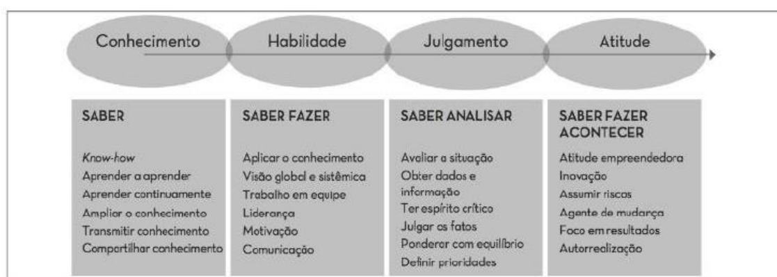
Competências essenciais do administrador.

Chiavenato (2007) diz que os resultados chegam com mais eficiência quando o administrador possui, dentre muitas, essas 4 competências: conhecimento, habilidade, julgamento e atitude, pois elas são duráveis e podem ser modificadas dependendo do contexto, buscando sempre melhorar a equipe e os resultados. No quadro abaixo explica-se melhor: