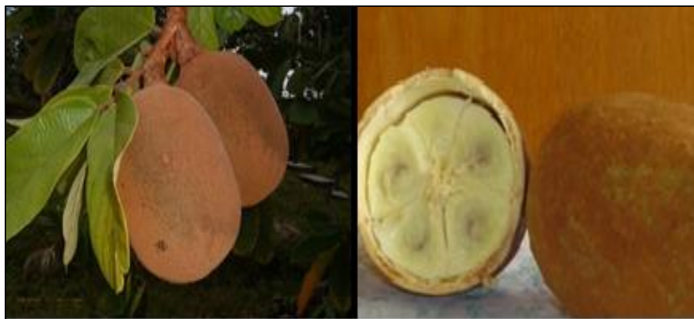
Figura 2 – Fotos ilustrativas do cupuaçu

De acordo com Godim et al. (2002), as variedades são agrupadas de acordo com o formato do fruto em: