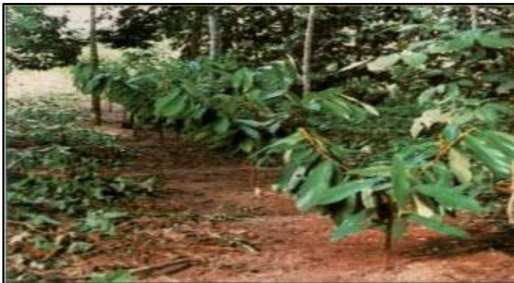
Figura 1 – Plantio de cupuaçu cultivado em condições de sub-bosque

O cupuaçuzeiro pode atingir 15 m de altura e 6 a 8 m de diâmetro de copa. É uma espécie tricômica, ou seja, cada ramo se divide em três, que crescem quase em paralelismo com o solo. As folhas jovens são de cor rósea e revestidas de pelos, atingindo em seu estágio final de 25 a 30 cm de comprimento, por 10 a 15 cm de largura, adquirindo uma tonalidade verde-escura. As flores se desenvolvem nos ramos mais periféricos, sendo uma espécie de polinização cruzada, com possibilidades de autofecundação. (FERREIRA et al., 2005 b).