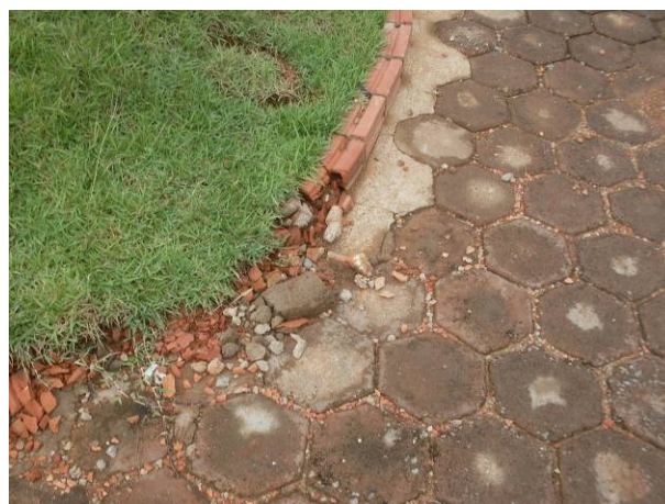
Foto 34-Meio fio de pavimentação em bloquete, executado em alvenaria 1/2x, deteriorado.