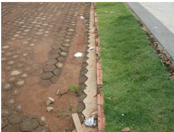
Foto 35- Pavimentação em bloquete defeituoso (recalque e meio fio deteriorado)