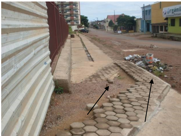
Foto 20 - Conserto de pavimentação asfáltica de pátio.

Foto 19- Caixas de passagem com entulhos, sem tampa, rachadas e sem reboco de acabamento.