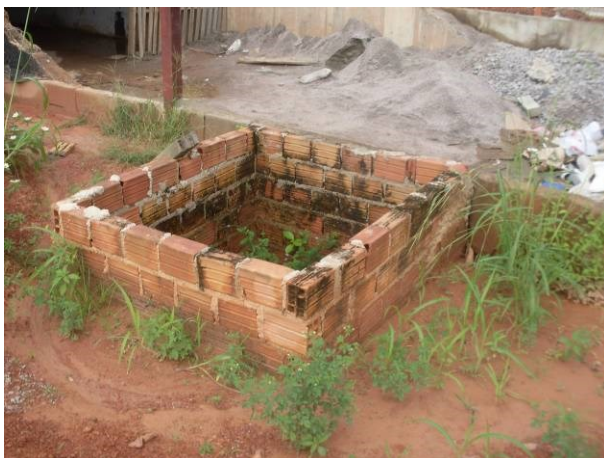
Foto 29 - Caixa de passagem de drenagem em material inadequado (alvenaria de 1/2x)