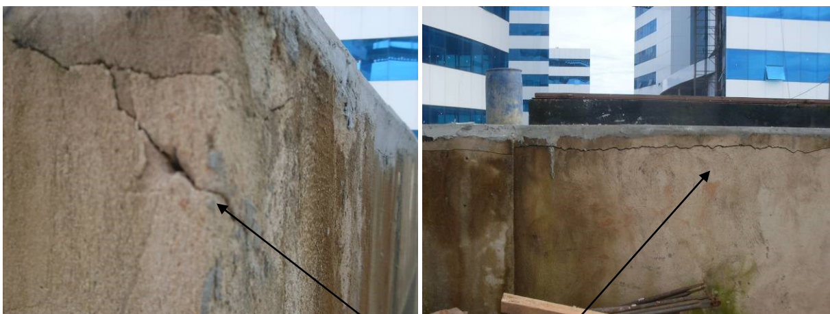
Foto 11 e 12- Rachaduras nas alvenarias da parte civil da Substação.

Foto 9- Parte Civil de Subestação. Foto 10- Entrada para tubo Armico. Alvenaria sem reboco de acabamento.