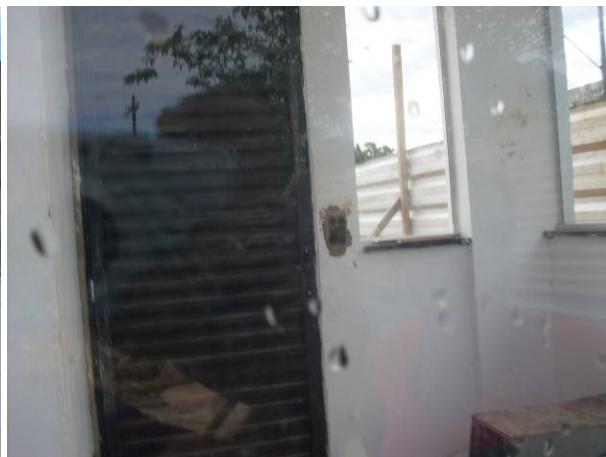
Foto 15 e 16 - Defeito no peitoril e reboco interno de guarita.