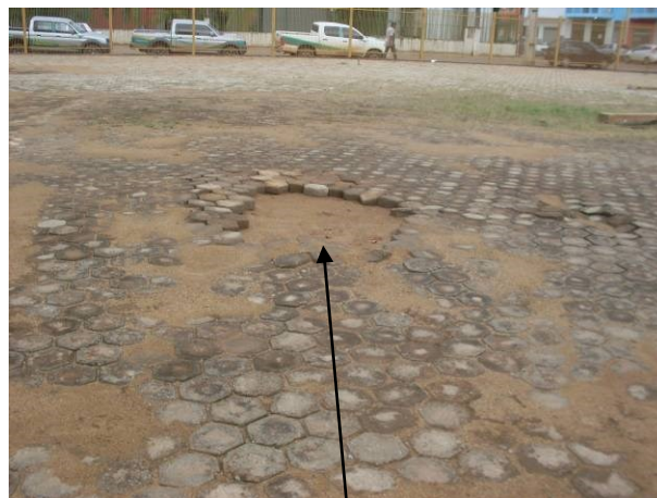
Foto 4- Piso em bloquete de concreto defeituoso.