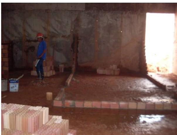
Foto 39- Alvenaria no sub-solo do auditório em início de execução.