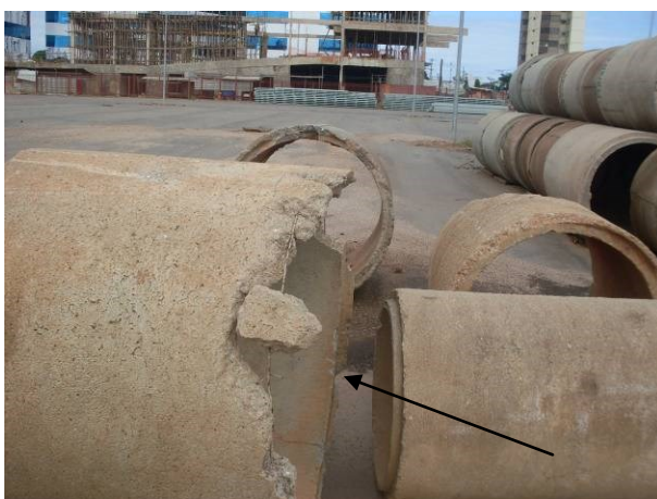
Foto 27 - Tubulação guardada no pátio, onde se verifica falhas e defeitos .