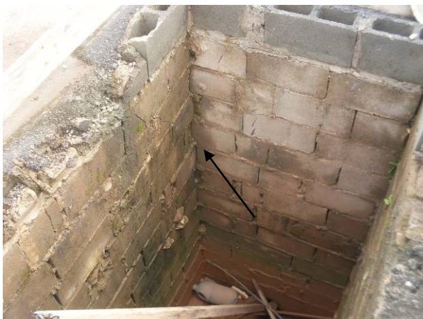
Foto 18 - Entulhos e falta de acabamento de caixa de passagem em pé de postes de iluminação.

Foto 17 - Falta de acabamento entre pavimentação asfáltica e mureta.