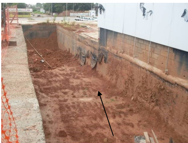
Foto 41- Local onde esta sendo efetuada escavação para execução de túnel de acesso ao Auditório.