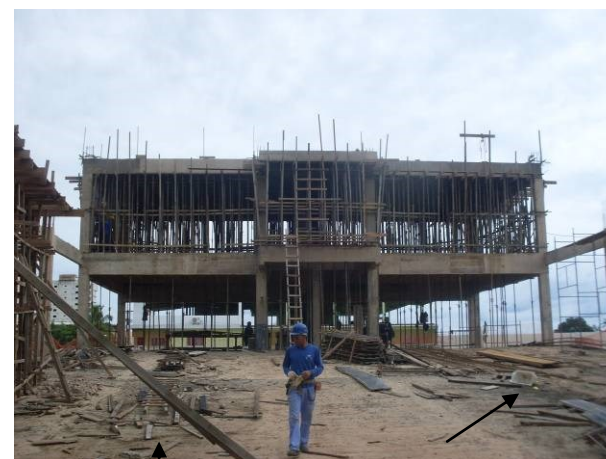
Foto 40- Operários trabalhando na execução de estrutura de concreto do auditório. Falta de limpeza do local.