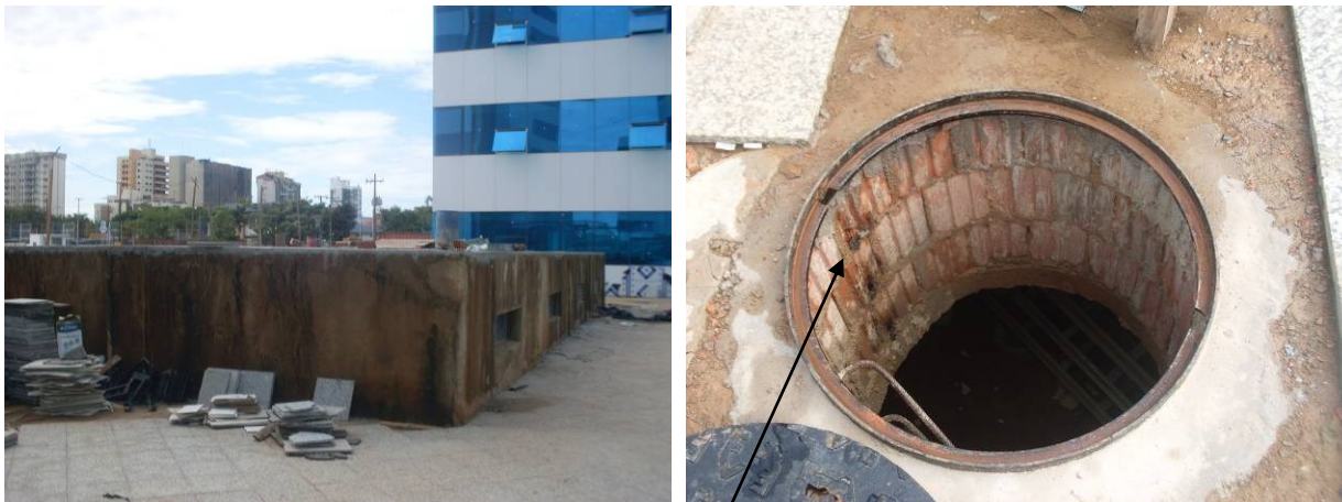
Foto 9- Parte Civil de Subestação. Foto 10- Entrada para tubo Armico. Alvenaria sem reboco de acabamento.

Foto 8 - Estrutura de Concreto armado de Auditório em execução.