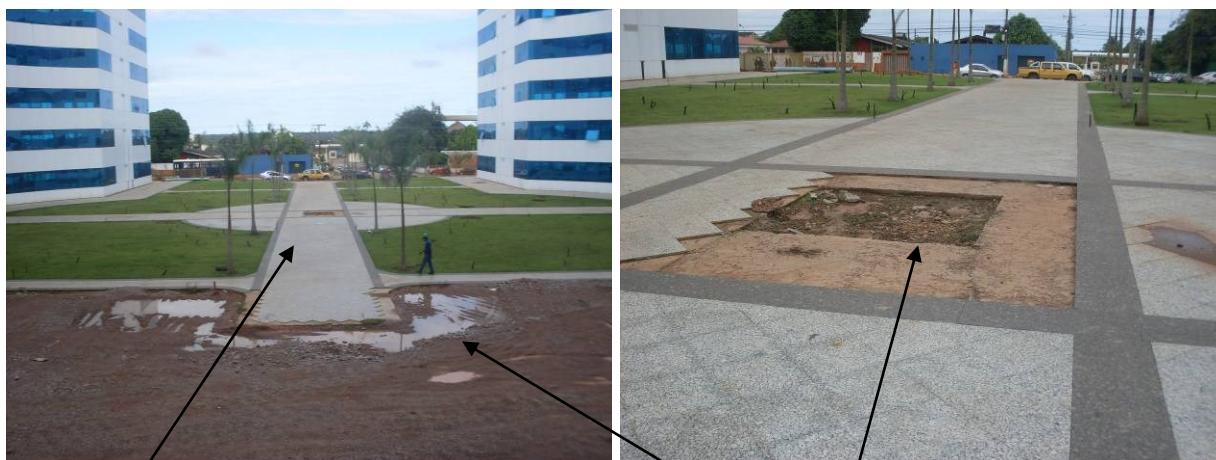
Foto 1- Parte central do terreno que recebeu urbanização.

Relatório fotográfico, apresentado a seguir: