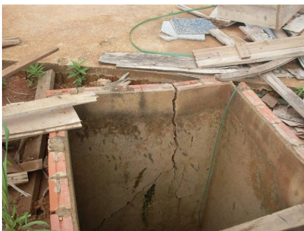
Foto 33-Caixa de passagem para drenagem, executada indevidamente em alvenaria 1/2X, rachada e deformada, que necessitará ser refeita.