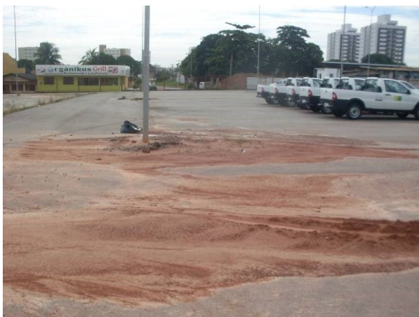
F31- Acúmulo de sedimentos por deficiente escoamento pluvial. F32 - Sedimento de pavimento junto a caixa passagem.