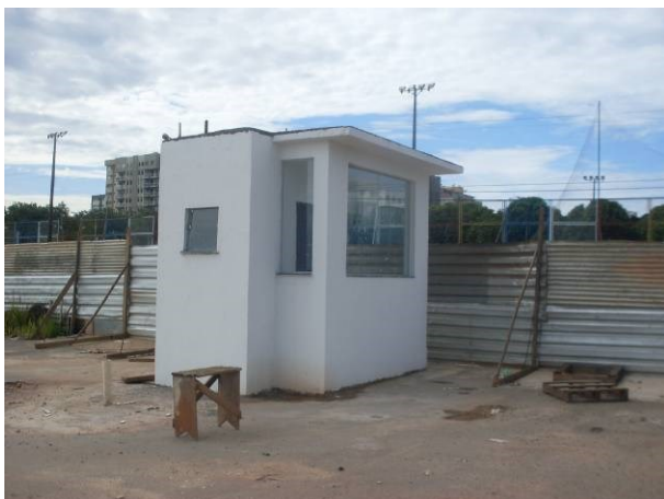
Foto 5- Uma das guaritas em fase final de execução.