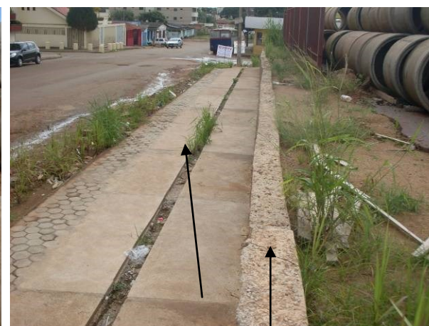
Foto 28 - Muro de Arrimo no fundo do pátio, executado por aditivo, mas sem detalhamento nos autos, calçada cimentada e em bloquetes. Vê-se que no espaço deixado para instalação de sinalização tátil, esta crescendo vegetação devido a morosidade da obra.