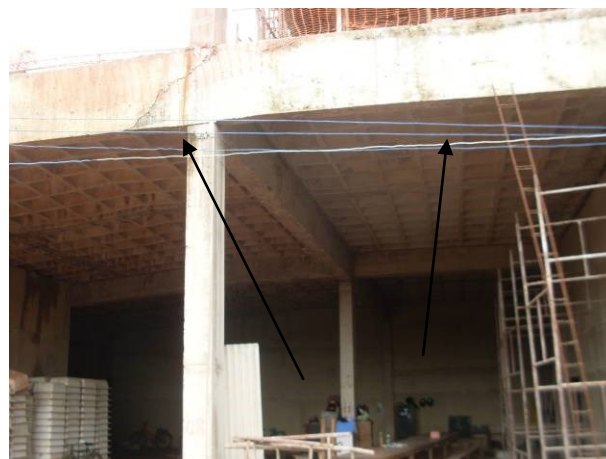
Foto 37-Ferragem junto a obra de auditório em contato com solo e vegetação, cuja utilização pode comprometer a qualidade da estrutura. Foto 38 – Viga de auditório com defeitos de concretagem