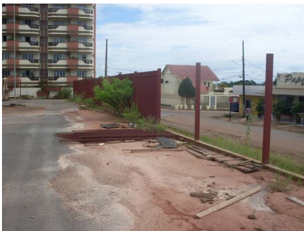
Foto 25 - Sedimentos acumulados junto a mureta, por inadequado escoamento pluvial.