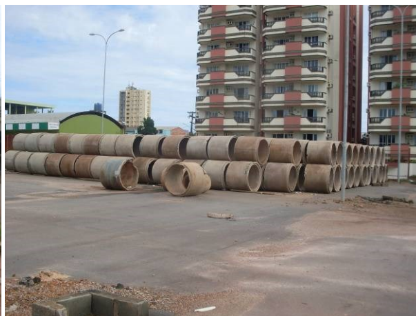
Foto 26- Uso do pátio do CPA, para guarda de tubulações em concreto.