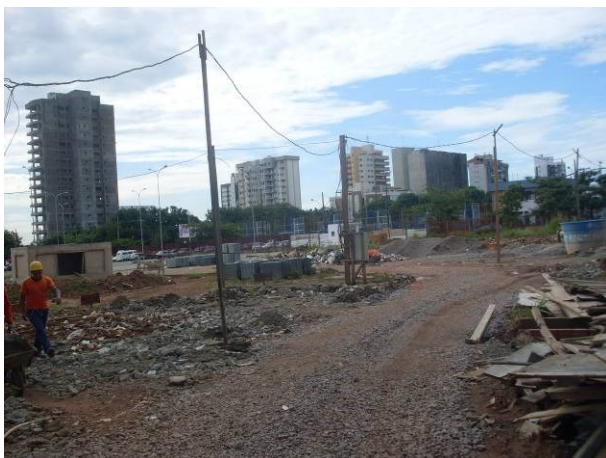
Foto 3- Parte do terreno que não recebeu urbanização.