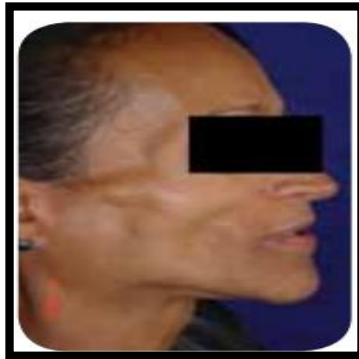
Figura 3: Lipoatrofia facial, com perda de tecido adiposo nas regiões nasofaringeana, periorbital e temporal.

Alguns fatores são correlacionados a predisposição da lipoatrofia, os análogos timidínicos, etnia caucasiana, baixo índice de gordura corporal, incidência maior no sexo masculino, início da terapia tardia apresentando infecção avançada pelo HIV e/ou coinfeção, baixa ou alta contagem de células CD4+, e aumento do ácido láctico. (BRASIL, 2011e).