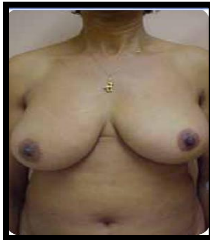
Figura 5: Acúmulo de gordura em região mamária.