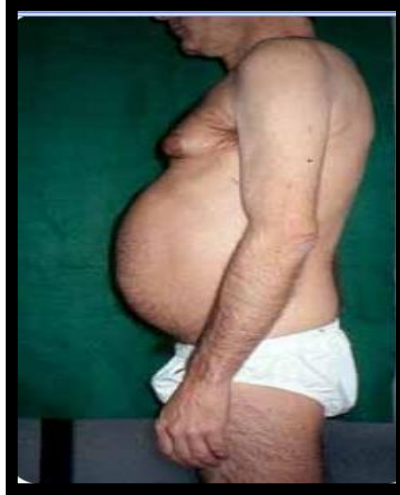
Figura 4: Acúmulo de gordura visceral, evidenciado pelo aumento de circunferência abdominal e lipoatrofia nas nádegas.