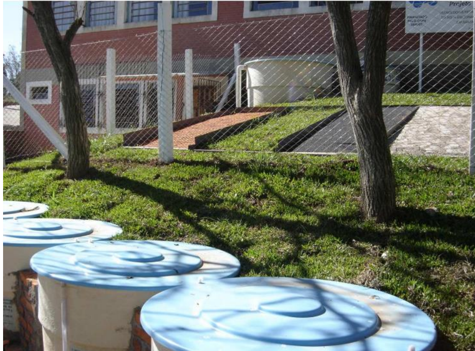
Figura 5 - Parcelas e caixas coletoras instaladas na Escola