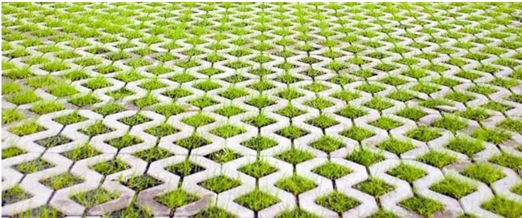
Figura 1 - Pisos intertravados

A Figura 1 representa um dos tipos de pavimentos permeáveis mais conhecidos, que é o pavimento de blocos vazados com cobertura de grama.