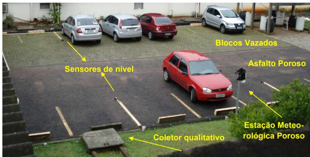
Figura 2 – Pavimentos permeáveis no estacionamento do Instituto de Pesquisas Hidráulicas/UFRGS

O estacionamento que foi analisado é caracterizado pelo tráfego de veículos leves e raramente serve como acesso para veículos pesados. O pavimento pode ser observado por meio das Figuras 2 e 3.