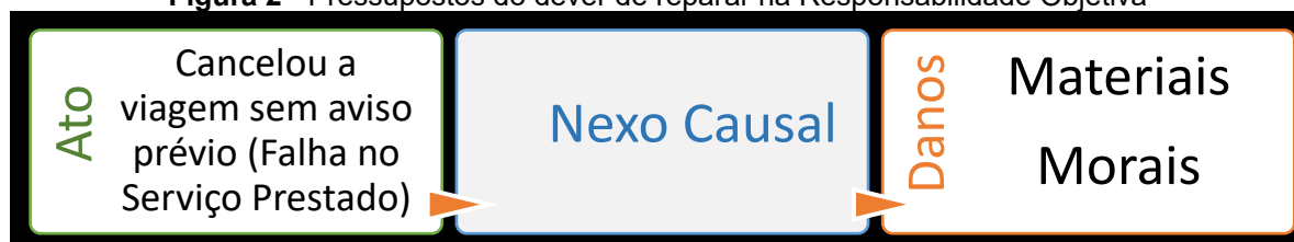
Figura 2 - Pressupostos do dever de reparar na Responsabilidade Objetiva

Desse modo, as empresas aéreas devem ser responsabilizadas pelos danos experimentados pelos consumidores, integralmente, por aplicação da Teoria do Risco, estampada no art. 927, parágrafo único, do CC/2002, bem como no art. 14 do CDC.