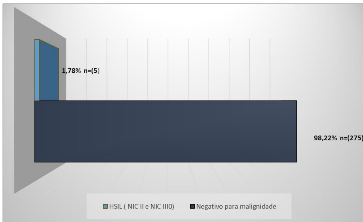
Figura 3. Conclusão dos laudos citopatológicos

fatores de risco associados ao câncer, a incidência por DST ainda continua sendo um problema de saúde pública.