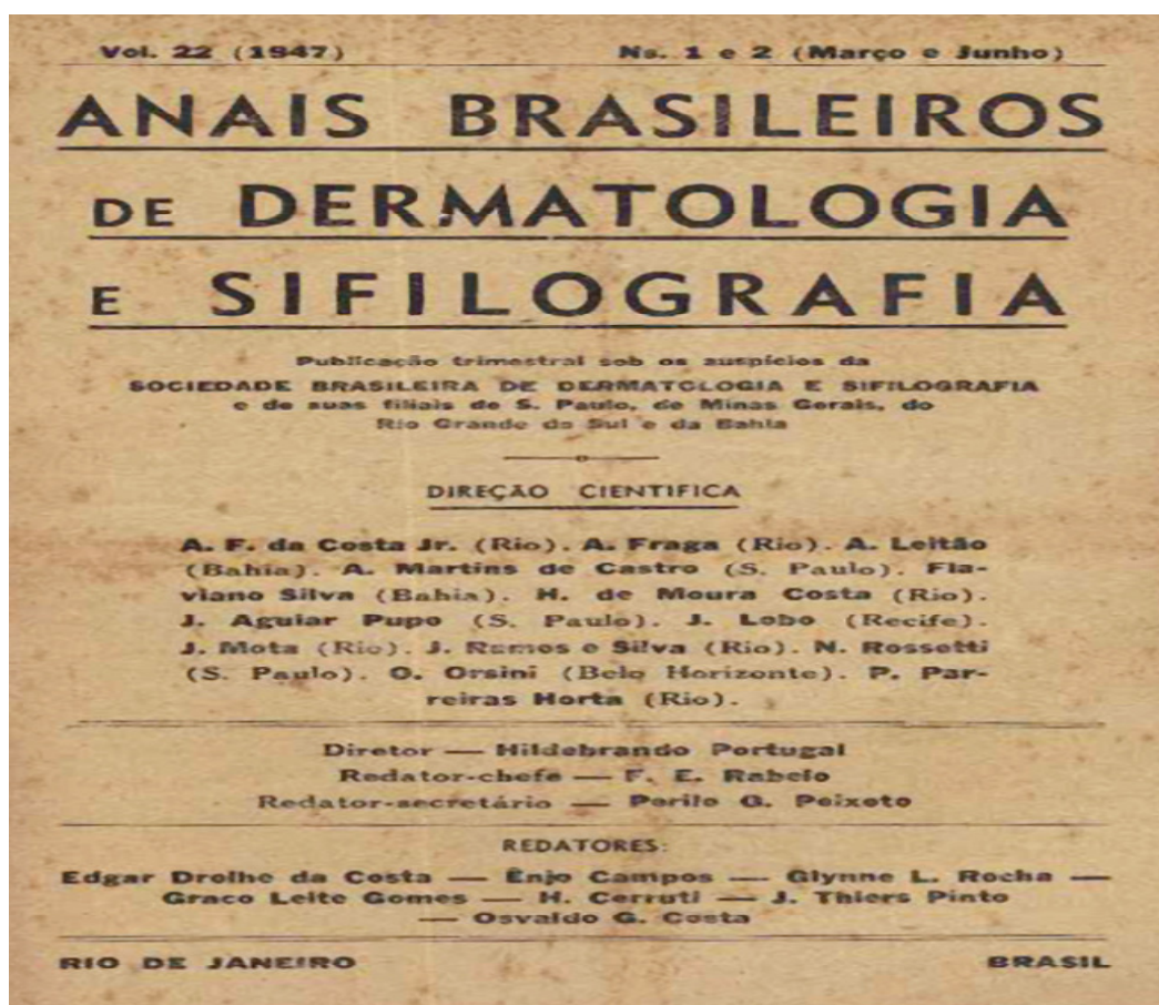
Figura 1- Anais Brasileiros de Dermatologia e Sifilografia

A sífilis é uma doença infecciosa crônica, que acomete todos os órgãos e sistemas e que vem desafiando há séculos a humanidade. Apesar de o seu tratamento ser eficaz e de baixo custo, tornou-se um grave problema de saúde pública. A sífilis ficou conhecida na Europa no século XV e logo disseminou por todo o continente, tornando-se uma praga mundial. Devido o grande acometimento da pele e mucosas ficou associada à dermatologia como mostrada na figura 1. (AVELLEIRA; BOTTINO, 2006).