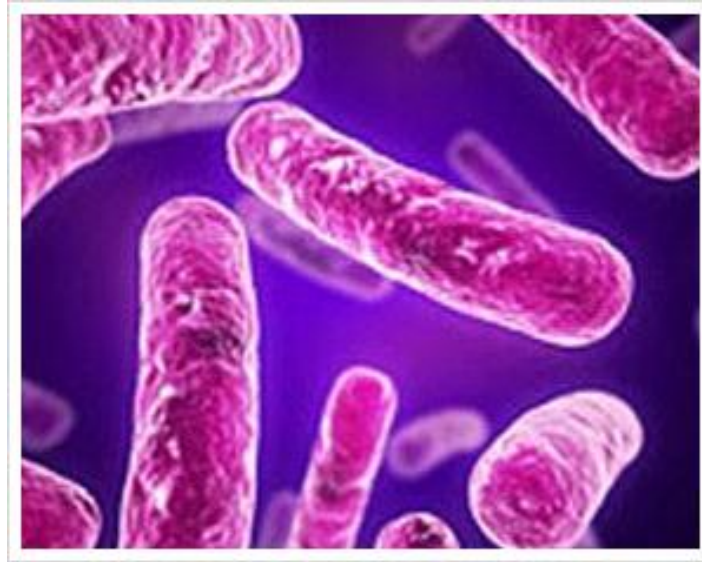
Figura 1 - Mycobacterium tuberculosis

Mycobacterium tuberculosis é um bacilo reto ou ligeiramente curvo, imóvel, não esporulado que mede de 1 a 10 µm de comprimento por 0,2 a 0,6 µm de largura, o agrupamento dos bacilos são em forma de ramos alongados e tortuosos, conhecidos por cordas, como demonstrados na figura 1. (BRASIL, 2002).